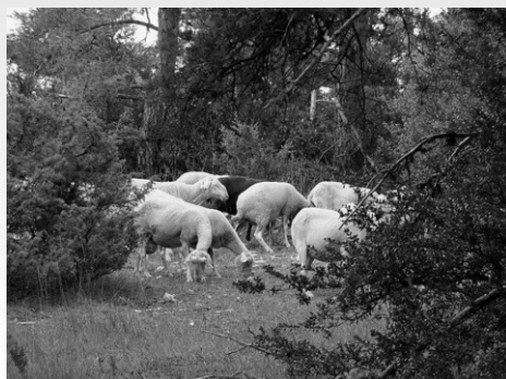
Photo 1 (à gauche) : Les pins ont envahi les parcours trop longtemps délaissés par les troupeaux...

Photo 2 (à droite) : ...alors qu'ils y retrouvent maintenant du pâturage.